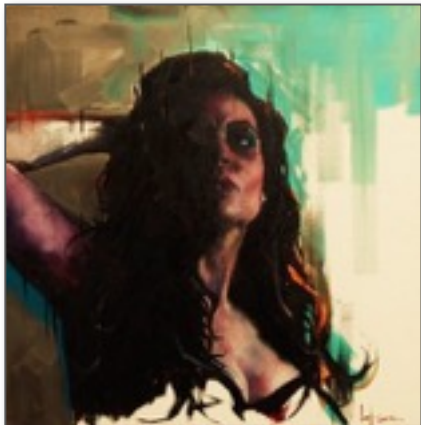
Ief Peeters – "Don't you ever tame your demons" (olie op doek)

Op 9 en 10 april 2016 geeft Ief Peeters een tweedaagse workshop Portret en Model tekenen bij atelier VONC. Deze workshop is geschikt voor zowel beginners als gevorderden , omdat Ief start vanaf het begin en van daaruit het thema verder uitbouwt.